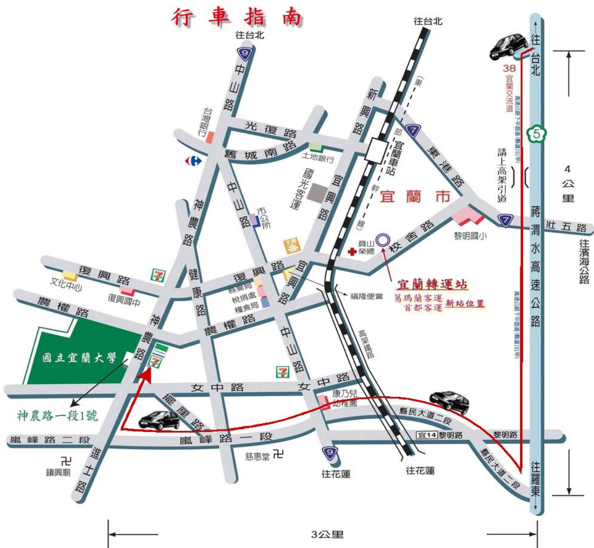
宜蘭大學交通路線圖